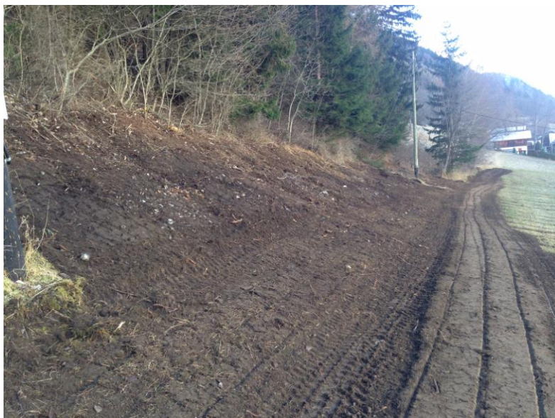
Unterhalt einer Freileitung